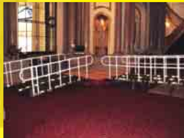
ROLL-A-RAMP A BUCKINGHAM PALACE